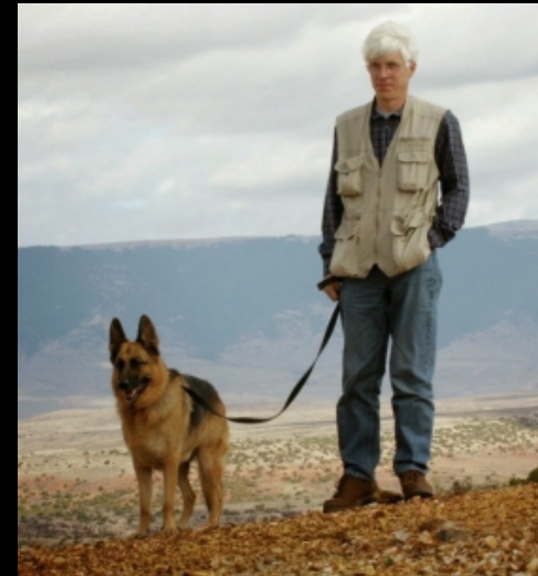
A gének a gazdi

Eszerint a feladat az, hogy fejtsük meg, mikor épp miképpen szolgálja.